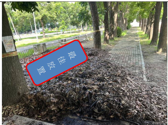
請將落葉集中至最佳放置點