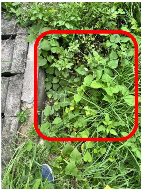
石塊集中後填補坑洞