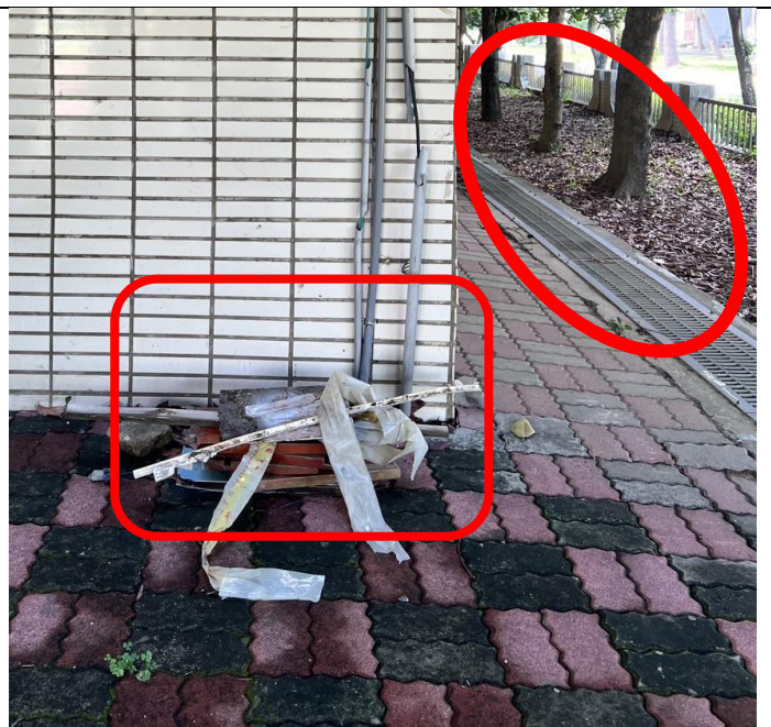
落葉需掃除、垃圾請丟棄至一般垃圾子車