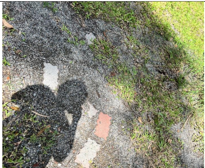
球場草地旁的石塊