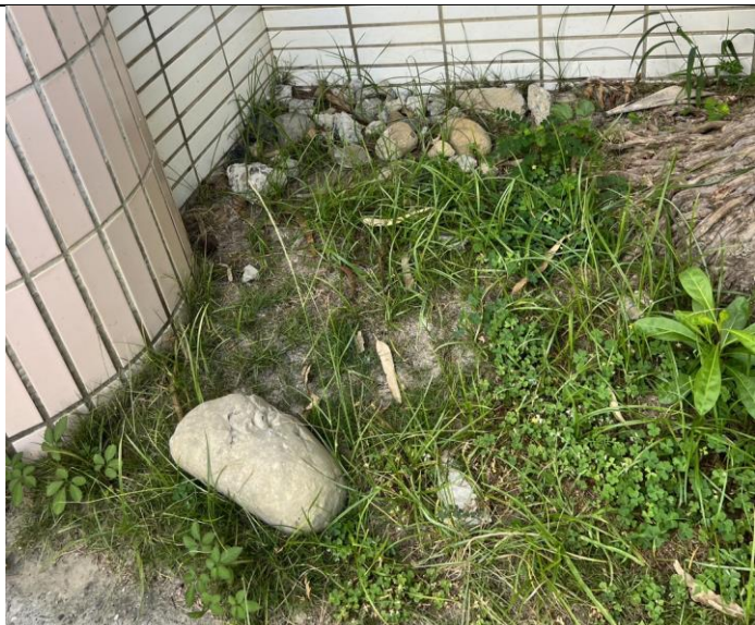
一導辦公室後方草叢內的石塊